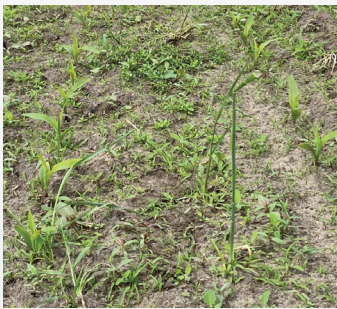
Hirse und weitere Unkräuter in Mais